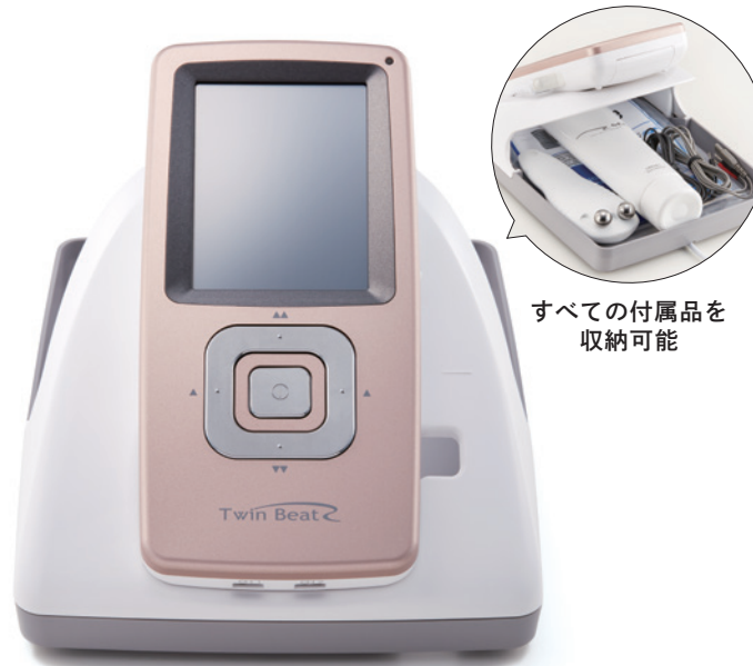
すべての付属品を 収納可能

*ケアコースは0～500(μA)、また、ビューティーコースは0～50(レベル/μA)